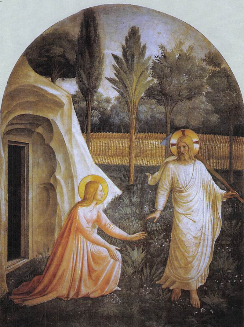
Fra Angelico: 「Noli me tangere= 我に触れるな」 (1438), Museum of San Marco